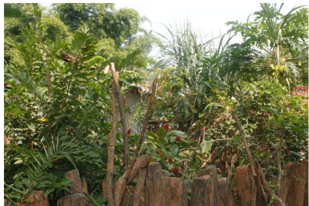
घर के बगीचे की विविधता